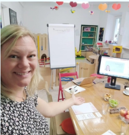
Workshops zur psychosozialen Gesundheit