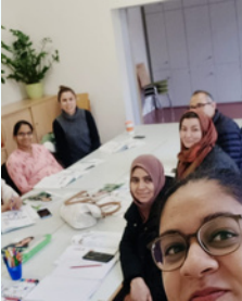
Deutsch- Offensive- Kurse

Für ausführlichere Informationen besucht bitte unsere Website: www.heimat-erlangen.de